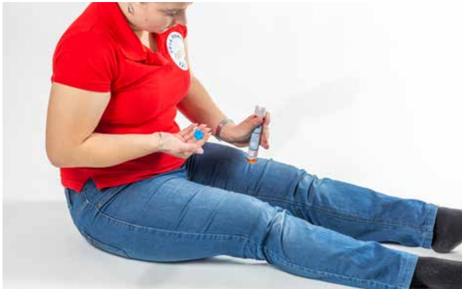
PP stehno pichnúť ja