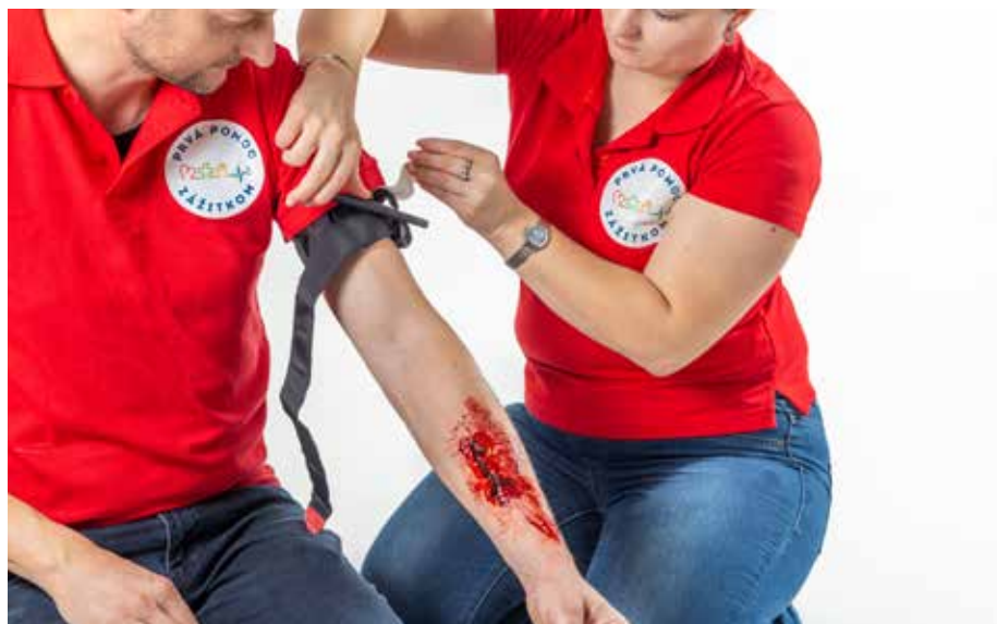
PP krvácať -turniket