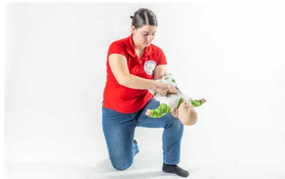
PP dusiť dieťa 5x tlačiť