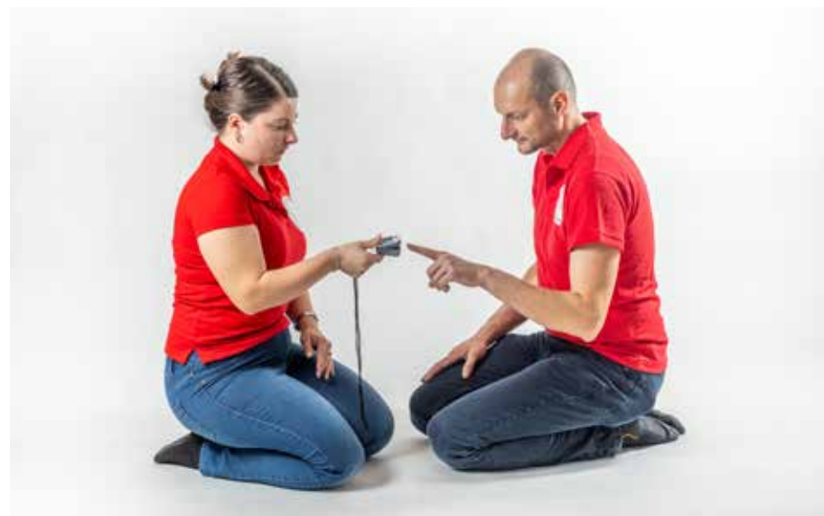
ZZ pulz 1 merať