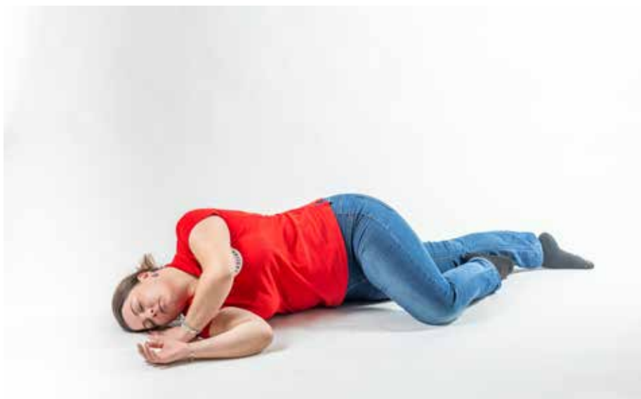
PP ležať bok