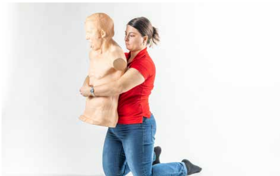
PP dusiť dospelý 5x tlačiť