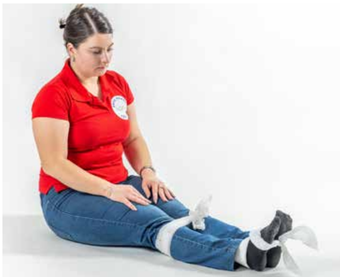
PP zlomit' noha