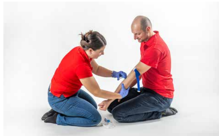
ZZ pichnúť ihla 1