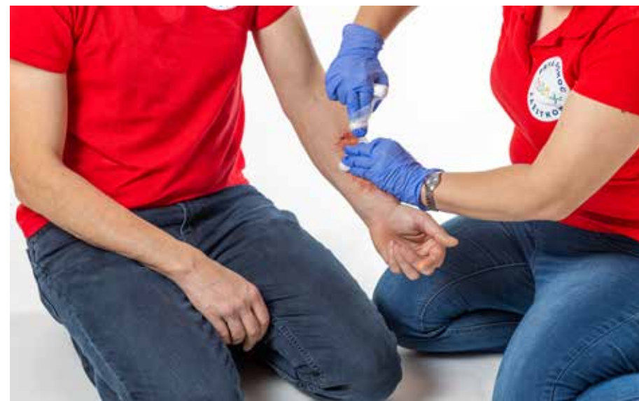
PP krvácať - dnu 2