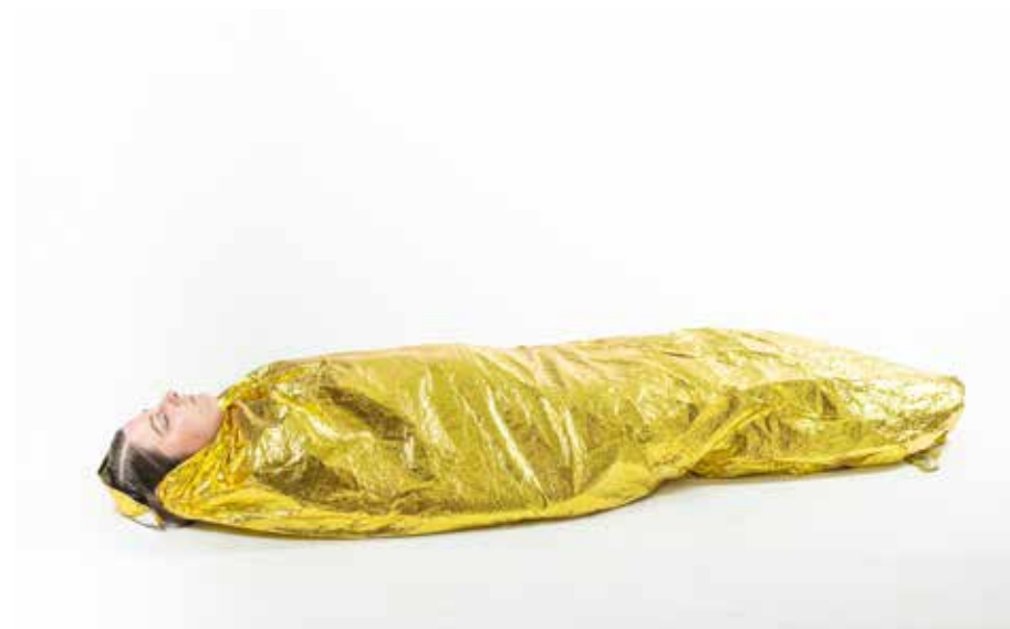
PP zabalit' fólia