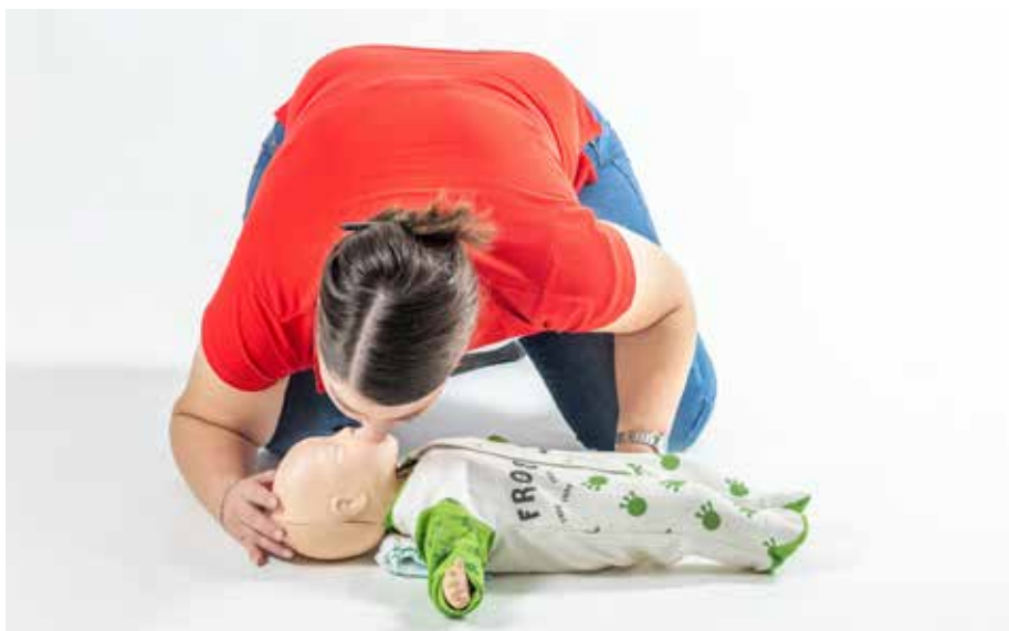
PP dýchať bábätko 2x