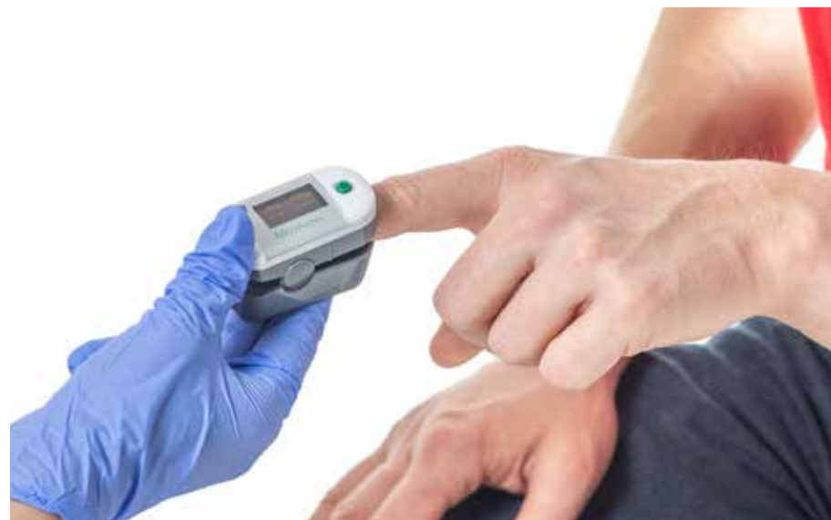
ZZ pulz 2 merať