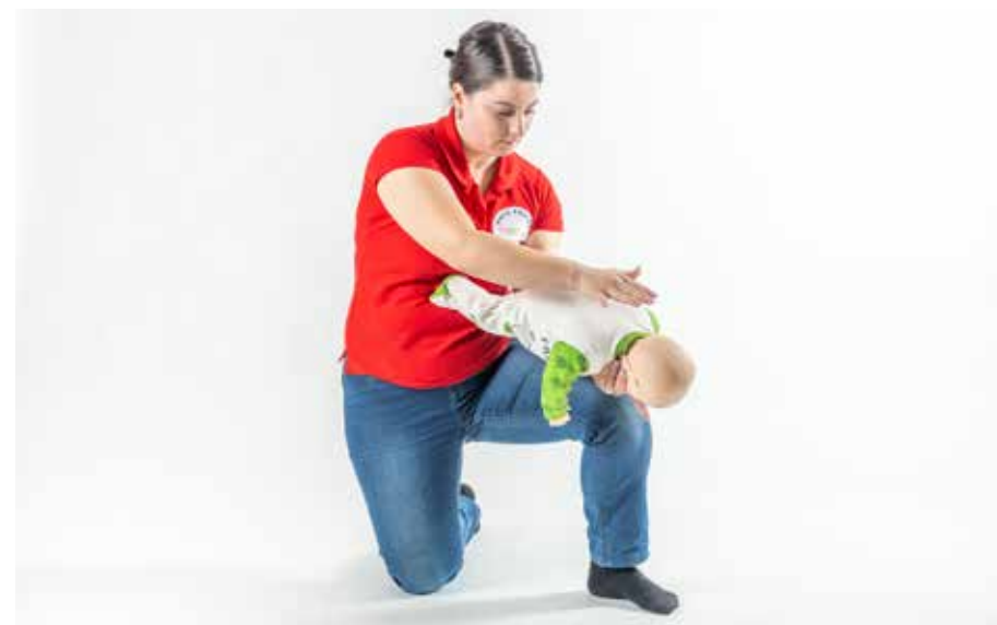
PP dusiť dieťa 5x búchať