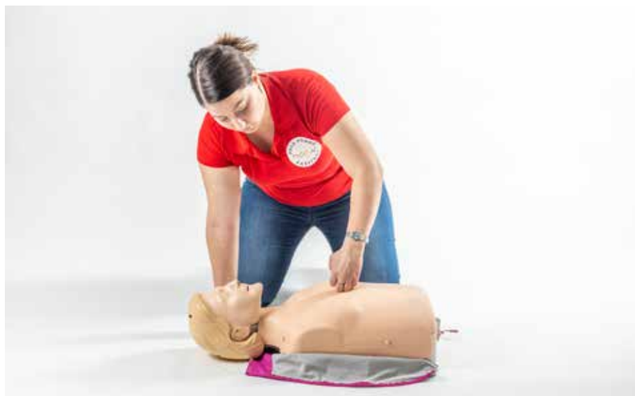
PP šúchať hrudník