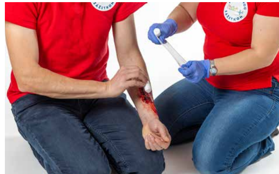
PP krvácat' - obvaz 1