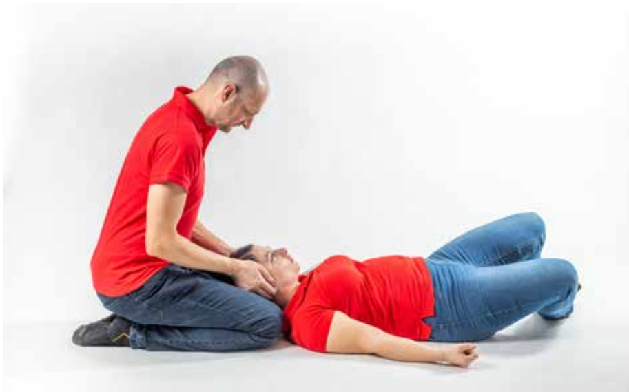
PP epilepsia - krčce držať hlava