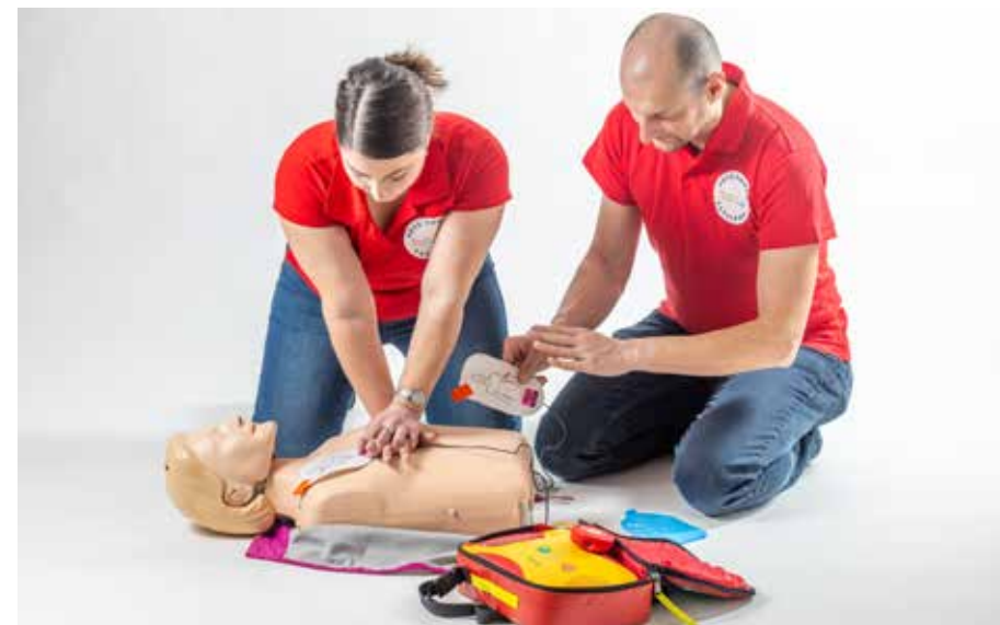
PP stláčať hrudník, lepiť elektródy