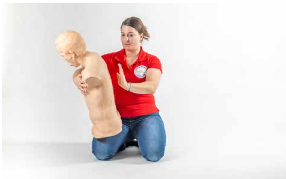
PP dusiť dospelý 5x búchať