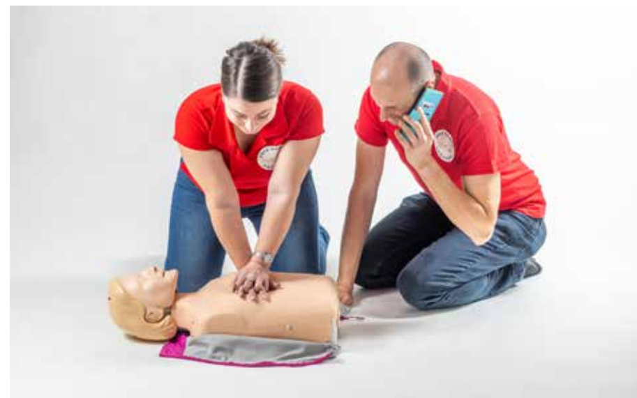
PP volať záchranka