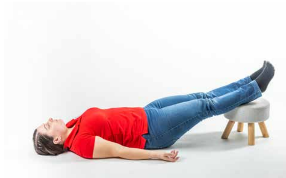
PP hore nohy