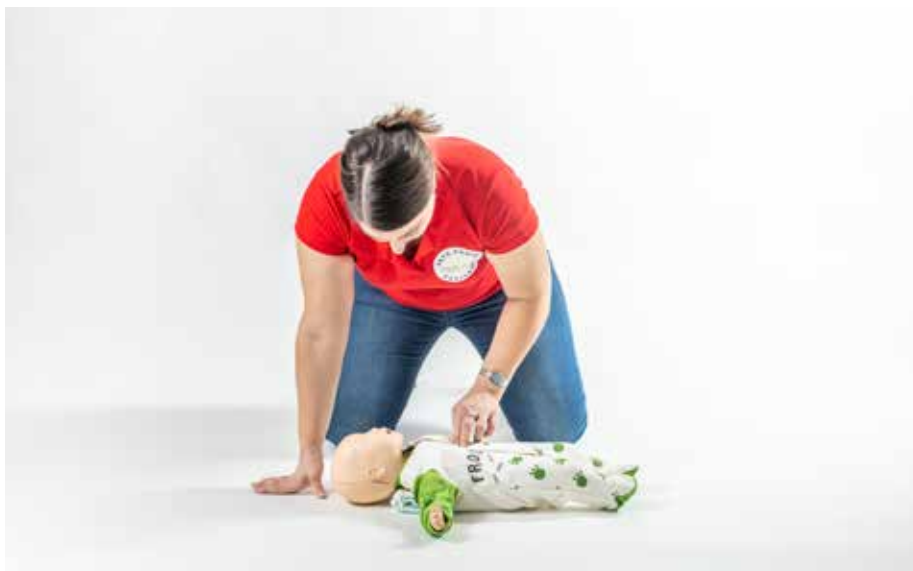
PP stláčať hrudník bábätko 2 palce 15x