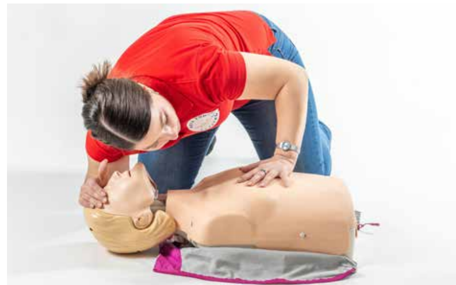
PP dýchanie pozerat