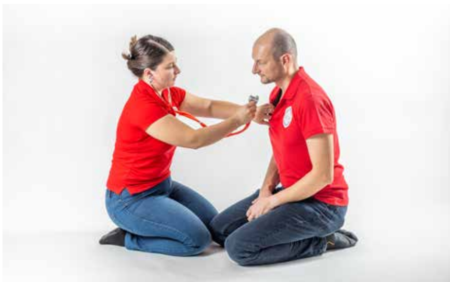
ZZ počúvať dýchať