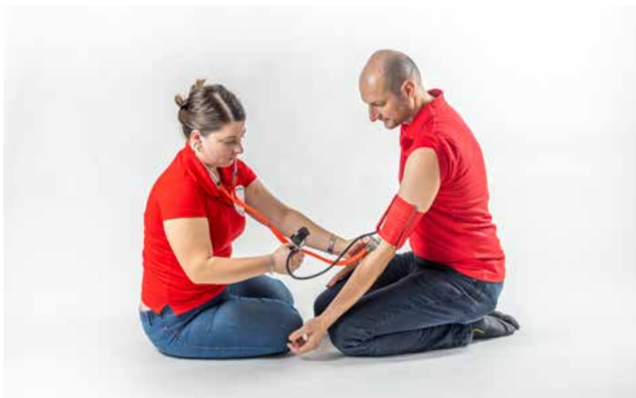
ZZ tlak merať