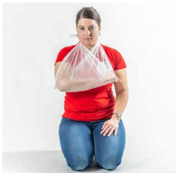
PP zlomit' ruka