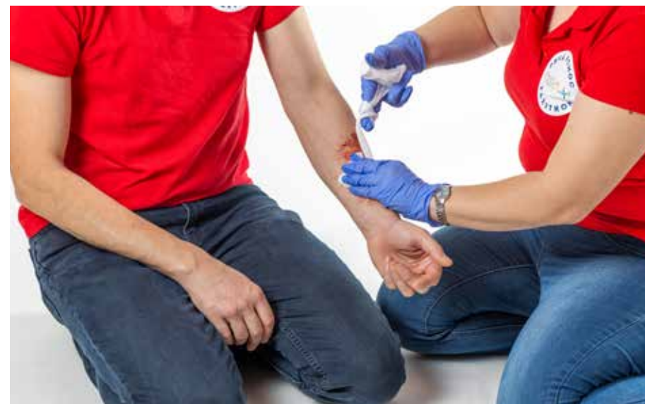
PP krvácať - dnu 1