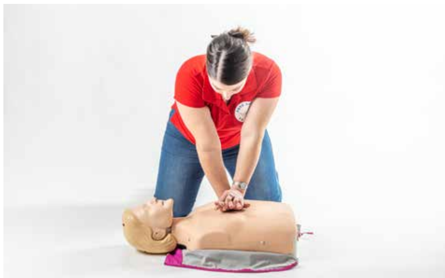
PP stláčať hrudník dospelý 2 ruka 30x