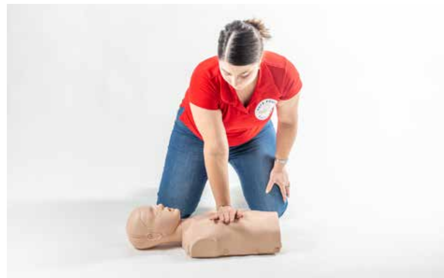
PP stláčať hrudník dieťa 1 ruka 15x