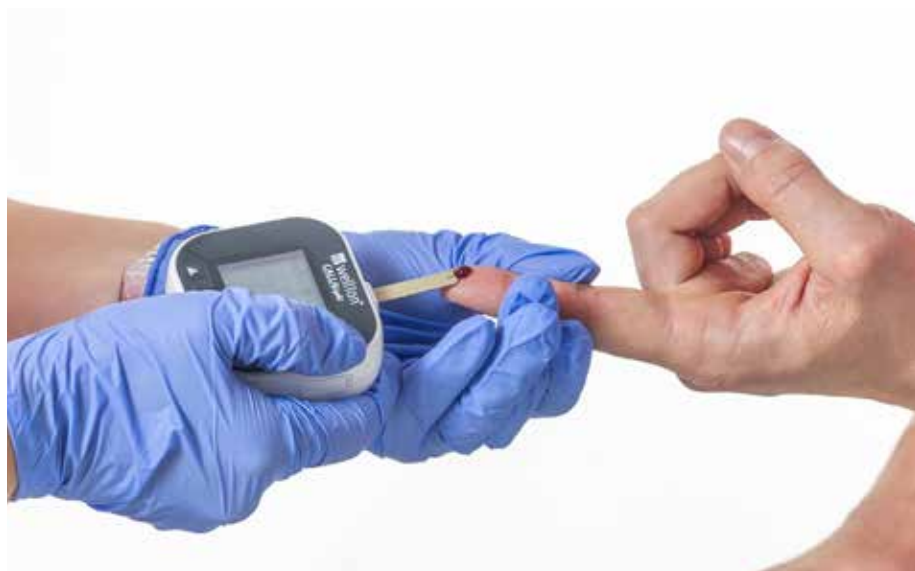
ZZ cukor 2