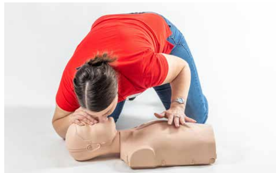
PP dýchať dieťa 2x