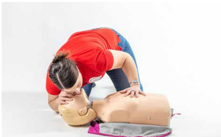
PP dýchať dospelý 2x