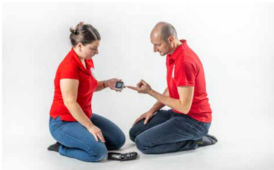
ZZ cukor 1