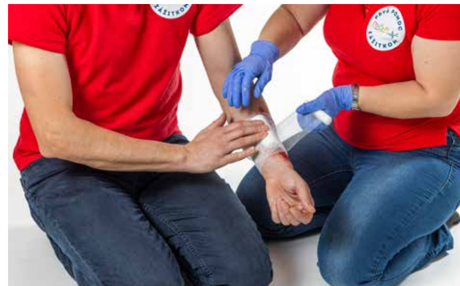
PP krvácat' - obvaz 2