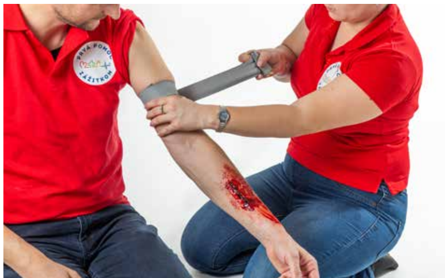
PP krvácať - škrtidlo